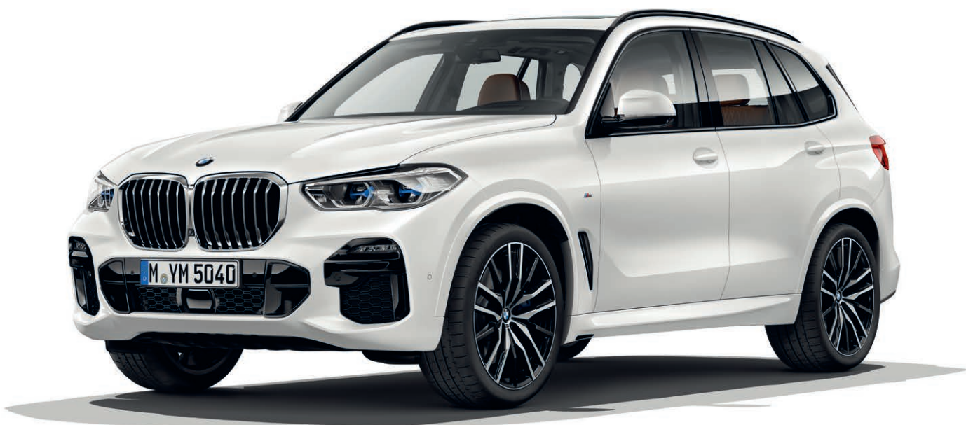
337 - Pakiet sportowy M – BMW X5 xDrive40i, Biel mineralna, 22-calowe obręcze kół ze stopu lekkiego M Double-Spoke 742 Bicolor (wyposażenie opcjonalne)