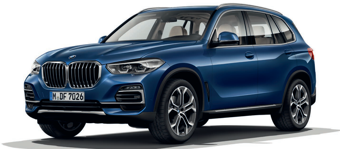
7HW - Pakiet xLine – BMW X5 xDrive40i, Niebieski Phytomic, 21-calowe obręcze kół ze stopu lekkiego Y-Spoke 744 Bicolor (wyposażenie opcjonalne)